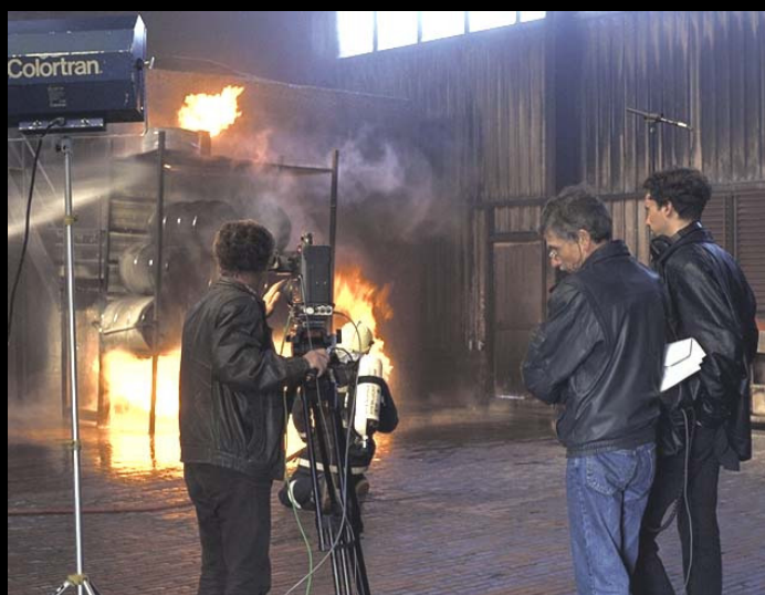
Werkopname tijdens "Het verhaal van Joram"

Educatieve videoproducties: Vanaf 1995 tot 2005 produceerde hij in eigen beheer educatieve video's voor het basisonderwijs.