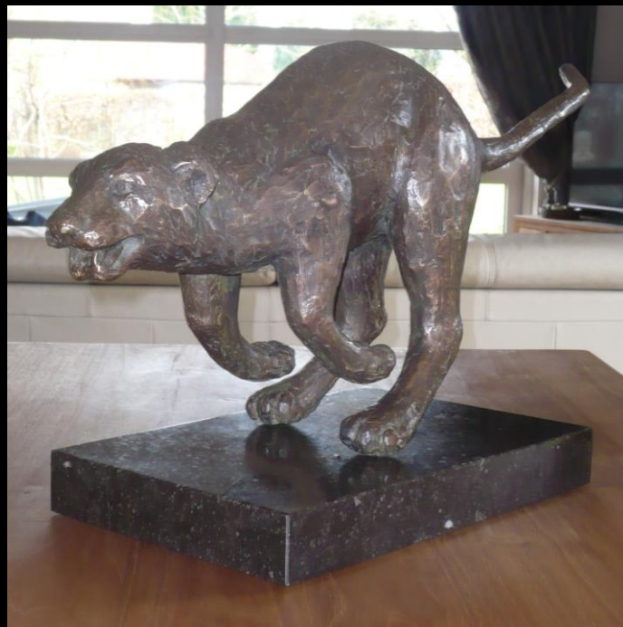
1 ste bronzen beeld