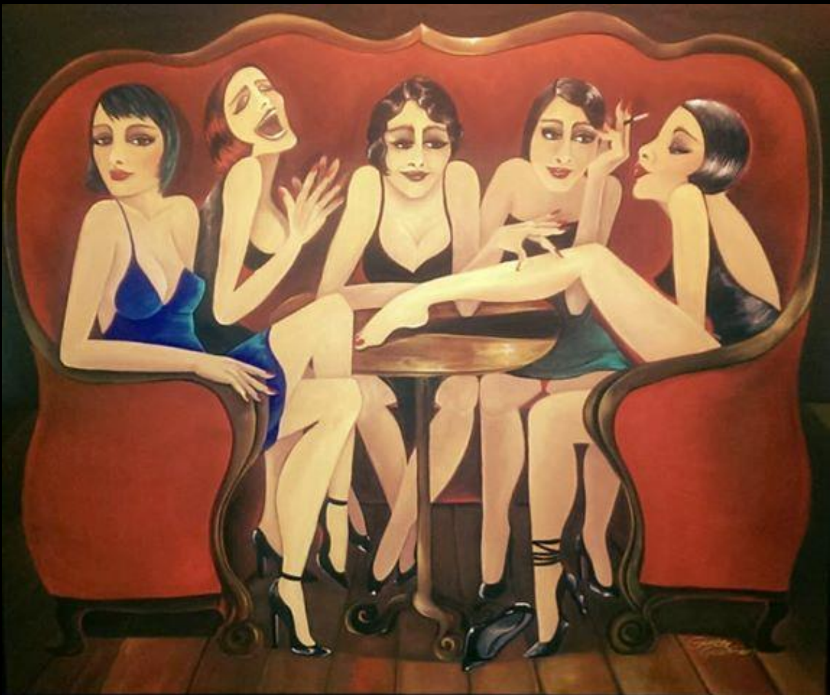
" Las Señoritas "

In de periode 1989 tot 1991 verbleef ze in Italië, Portugal en Spanje. Ze volgde er verschillende cursussen en de plaatselijke kunstenaars inspireerden haar. In 1993 vestigde ze zich in Erfurt Duitsland waar ze in 1995 haar eigen atelier opende.